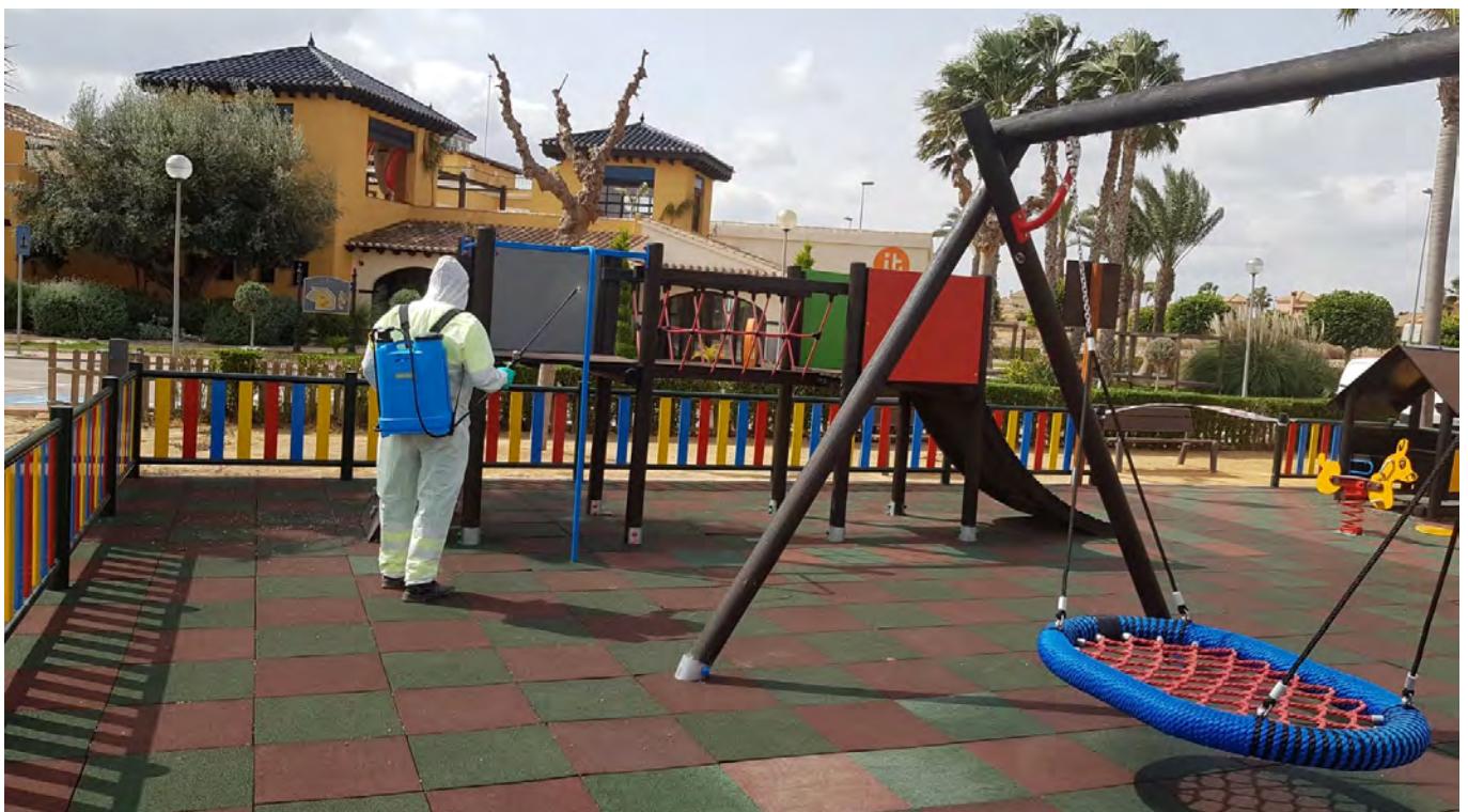
STV disinfecting the communities of HDA. // STV desinfectando las zonas comunes de HDA.