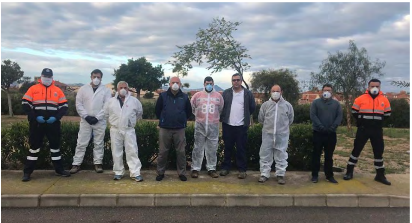
The volunteers of the city council Fuente Álamo, civil protection, farmers, business ... who passed in all districts for disinfection. Giving free time, materials, products ... for the good of the population. They did not forget HDA.//