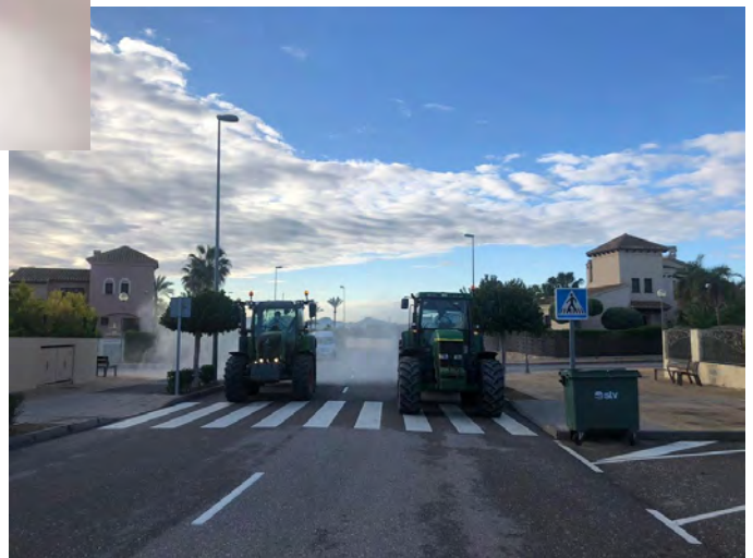
Village farmers' tractors disinfected the streets of HDA. // Tractores de los agricultores del pueblo desinfectados las calles de HDA.